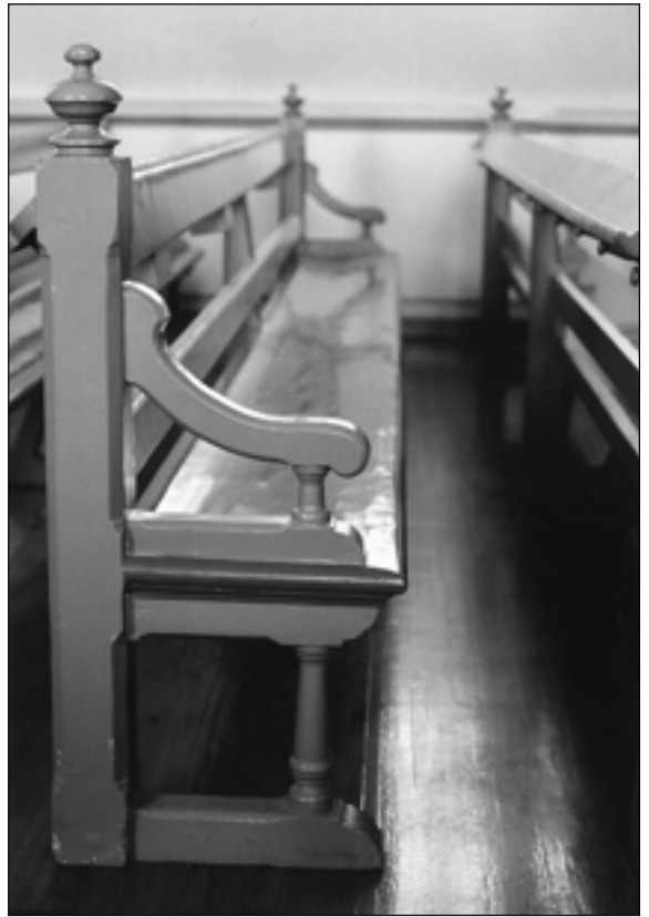
Kuopion Tuomiokirkko.

Pyhä-aamuna sakastiin kokoontuu seurakunnasta riippuen useitakin henkilöitä osallistuakseen alkaen jumalanpalveluksen eri tehtäviin, tässä tilanteessa voi tulla esille merkillinen tilanne, kun jokin pappi tulee viimeisten joukossa, niin hän tervehtii paikalla olijoita tietystä järjestyksessä. Suntio on kenties ovensuussa vastaanottamassa ihmisiä laittaakseen takkia nauhaan, häntä voidaan tervehtyä jos muistetaan tai sitten ei. Jumalanpalveluksessa