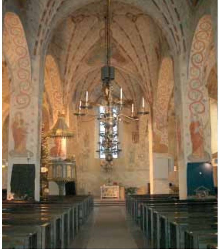
Lohjan Pyhän Laurin kirkko. Pyhä tie – Via Sacra.

Lähiopetusviikot antavat koulutuksen moniin eri tilanteisiin. Vuorovaikutustaitojen oppiminen on avartanut kykyä kohdata erityiset tilanteet viestinnän saralla. Suntion työssä ovat perinteiset viestintäkeinot puhuminen ja kuunteleminen parhaita tapoja keskinäisen ymmärryksen saavuttamiseksi. Opetuksen osana on ollut myös monipuolinen perehtyminen kristilliseen symboliikkaan ja estetiikkaan. Tämä on avannut uusia näkymiä, joita ei olisi osannut löytää ilman opasta. Lisäksi on perehdytty asiakasturvallisuuden kannalta tärkeisiin asioihin, kuten ensiavun antamiseen hätä- ja onnettomuustilanteissa.