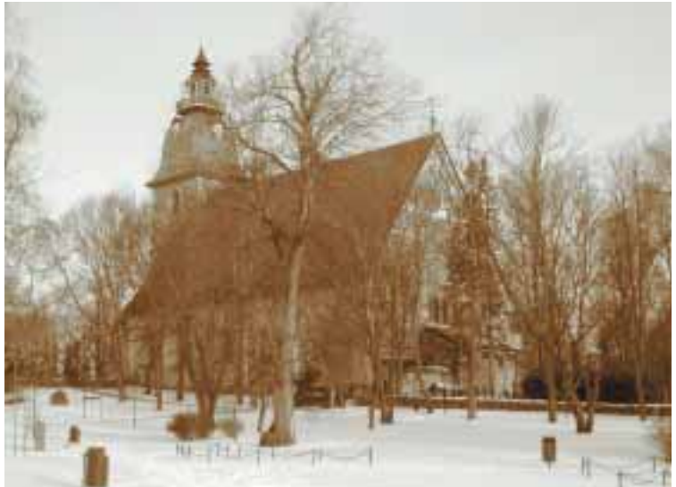
Naantalin kirkko.

SVTL:n jäsenyhdistyksen Kirkonpalvelijat ry:n uudet mallisäännöt päätettiin esittää vuosikokoukselle