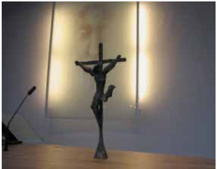
Tampereen Aitolahden kirkon alttari.