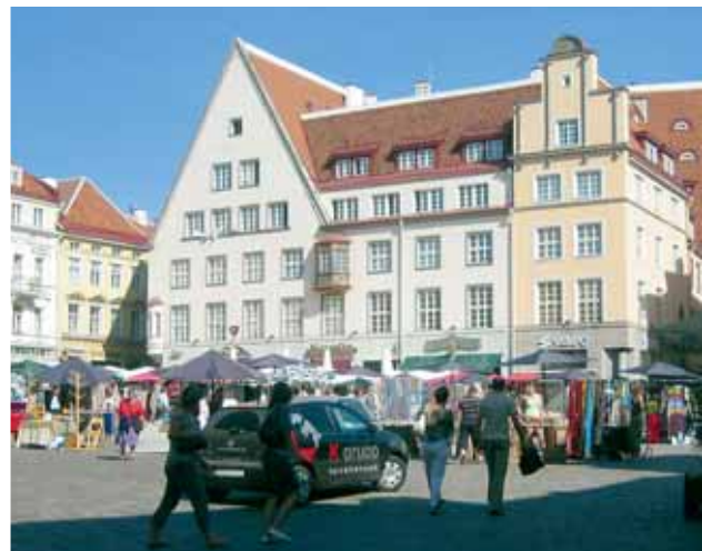
Kaunis päivä Tallinnan vanhassa kaupungissa. Kuva Raatihuoneen torilta.