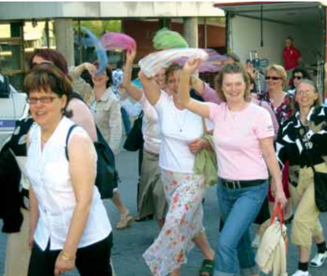
Kuopiolaiset lastenohjaajat vilkuttavat värikkäitä huivejaan.