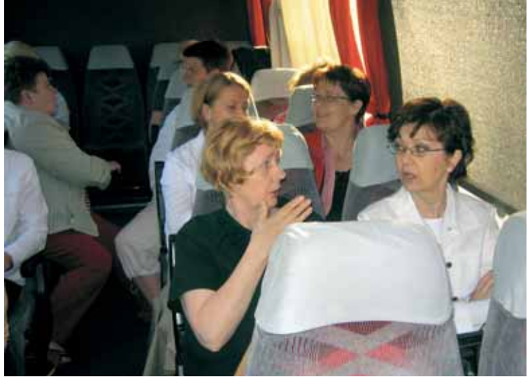
Linja-autossa ompi tunnelmaa.

Kiertoaajelulla kävimme presidenttiemme virka-asuntojen lähettävillä ja katselimme kauniista Helsingistä. Oppaaksi kiertoaajelulle ilmoittautui