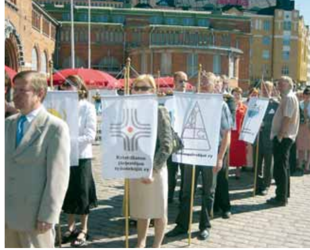
Kulkue järjestäytyy, kuvassa mm. yhdistyksen lippu.