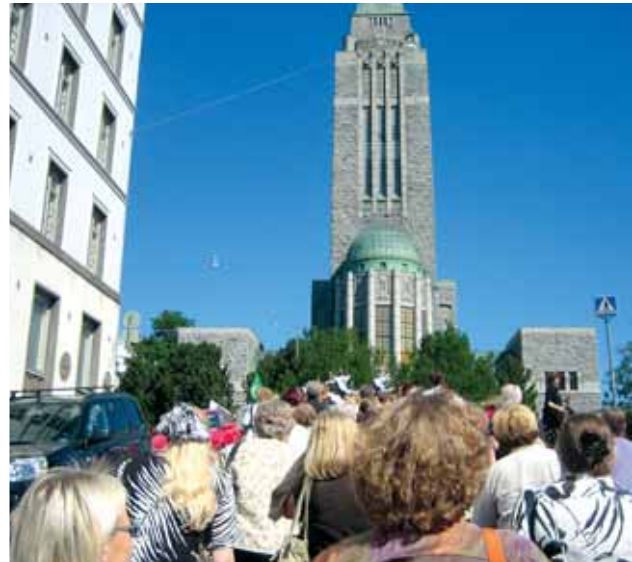
Kulkue Kallion kirkolle.