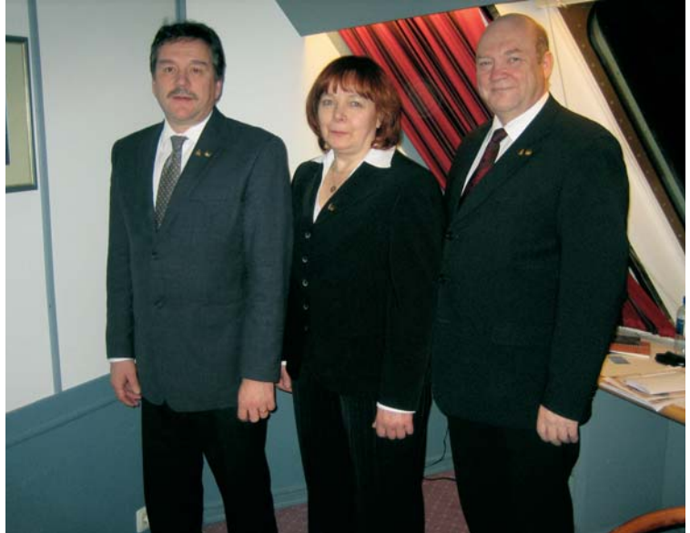
Yhdistystämme on siunattu ansiokkailla puheenjohtajilla.