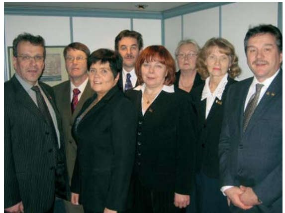
Hallituksen jäsenet "mustissaan".