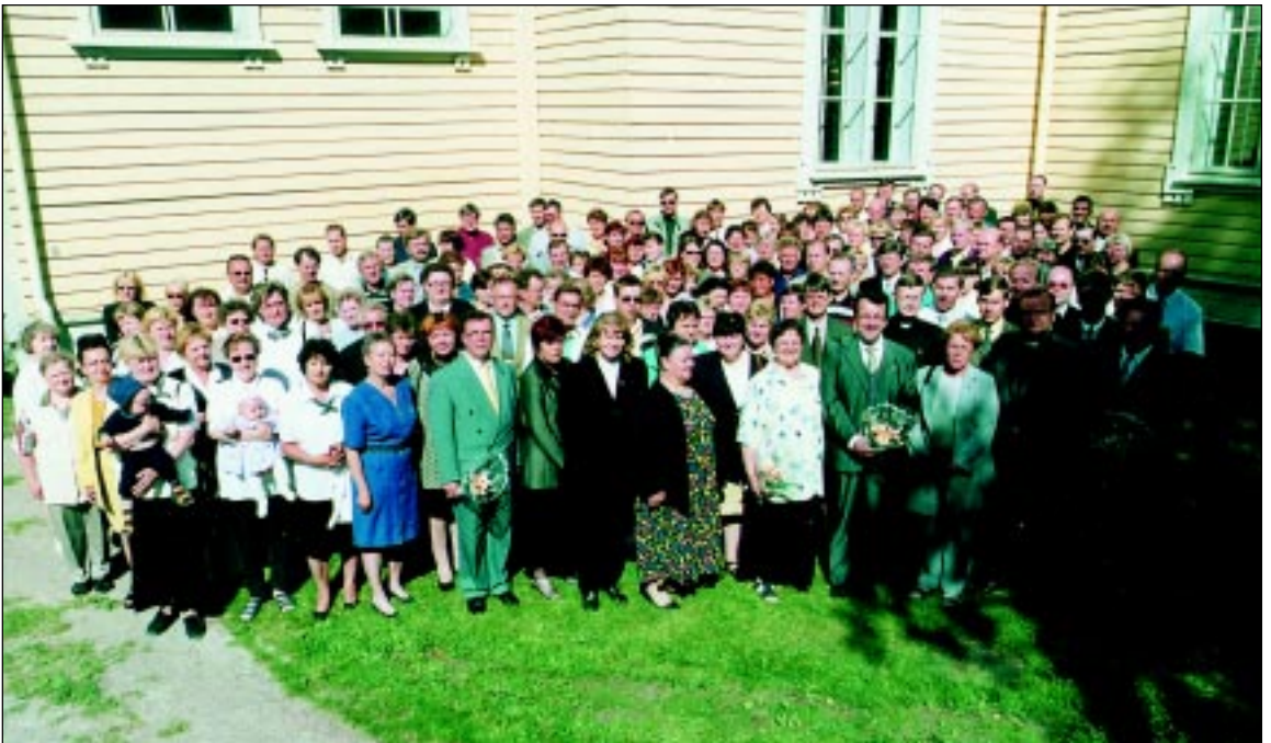
Kirkonpalvelijat ry:n opinto- ja koulutuspäiville osallistuneita Lappeen kirkon edustalla 27.6.2001.