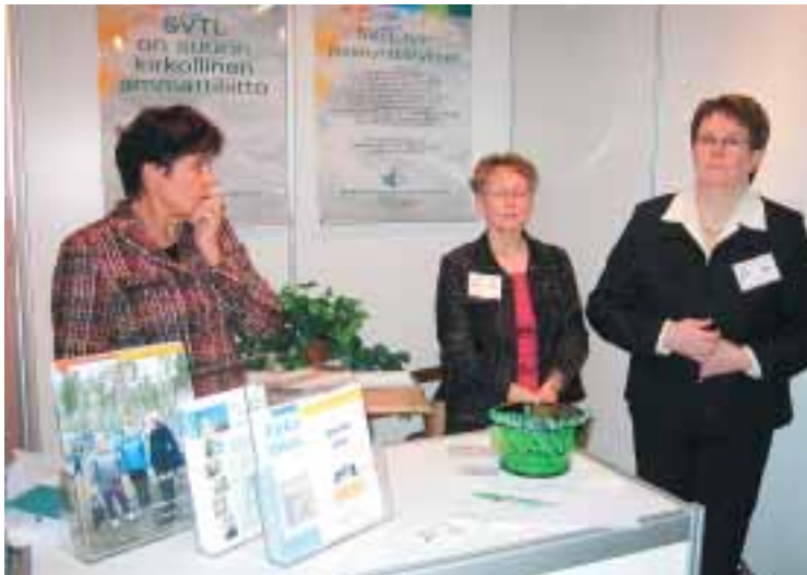
SVTL:n messuosasto teemapäivillä.