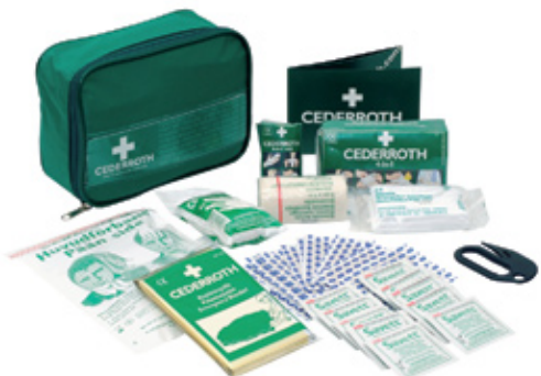
Reissumiehen ensiapupakkaus Tuotenumero 1956