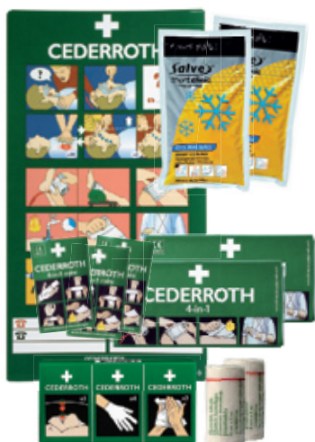
Ensiapukaapin sisältö Tuotenumero 2030