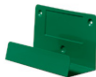
Seinäteline ensiapupakkeille Tuotenumero 190400