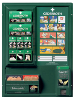
Haavanhoitopiste Tuotenumero 190900