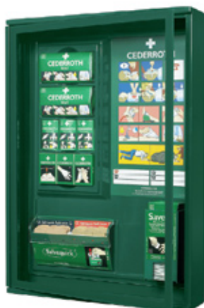
Haavanhoitopiste suojakaapissa Tuotenumero 390900