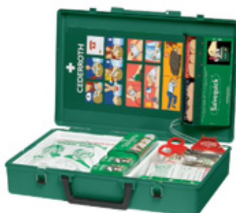
Ensiapupakki Tuotenumero 194100