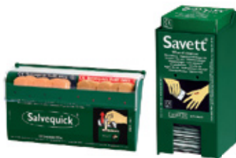
Laastariautomaatti Tuotenumero 1907