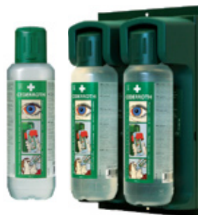
Silmänhuuhtelupullo Tuotenumero 7251