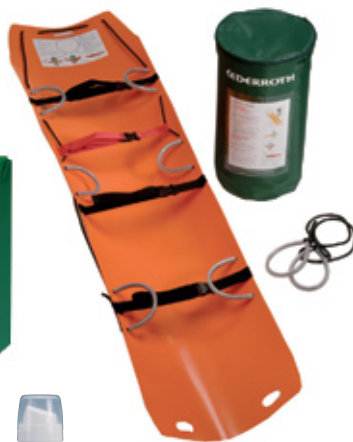
Kevytpaarit kantopussissa Tuotenumero 1530